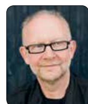
Prof. Dieter Falk Musikproduzent, Pianist und Komponist

Die Stärke einer Region und eines Wirtschaftsstandortes zeigt sich in dem Maße, wie auch mit schwachen und verwundbaren Bevölkerungsgruppen umgegangen wird. Viele Unternehmen aus dem Raum Düsseldorf unterstützen das Kinder- und Jugendhospiz im Rahmen ihrer CSR-Strategie und investieren in den nachhaltigen gesellschaftlichen Zusammenhalt. Ich bin froh und stolz, „Botschafter“ dieser wichtigen Düsseldorfer Einrichtung zu sein.