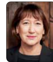
Hildegard Müller Präsidentin des Verbands der Automobilindustrie (VDA) und Staatsministerin a. D.

Das Regengebogenland ist für mich ein Ort der Liebe, der Geborgenheit und des Trostes, an dem die Kinder und ihre Familien immer wieder für einen Moment Ruhe und Unterstützung finden. Beeindruckend ist dabei die Lebenskraft, die Freude und die Zuversicht, mit der die Kinder ihren Alltag gestalten.