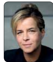
Mona Neubaur Ministerin für Wirtschaft, Industrie, Klimaschutz und Energie des Landes Nordrhein-Westfalen Stellvertretende Ministerpräsidentin des Landes Nordrhein-Westfalen

Die Initiative hat vor einem Vierteljahrhundert ein Tabu aufgebrochen und ein Umdenken erreicht. Vor allem, wenn wir uns vergegenwärtigen, wie die Situation für die betroffenen Kinder und der Alltag für die Familien vor der Gründung des Regengebogenlandes war: Wie verbrachten lebensverkürzend erkrankte Kinder, Jugendliche und junge Erwachsene ihre letzten Jahre, Monate oder Wochen? Welchen Belastungen waren die Familien ausgesetzt? Erst das Regengebogenland hat die Hospizarbeit für Kinder und Jugendliche in Düsseldorf fest verankert und entscheidend verbessert. Die Gründung war somit ein echter Meilenstein.