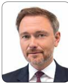
Christian Lindner Mitglied des Deutschen Bundestages Bundesminister der Finanzen Botschafter des Kinder- und Jugendhospizes Regengebogenland

Zum 25. Jubiläum des Kinder- und Jugendhospizes Regengebogenland: Das Schicksal von Kindern und Jugendlichen, die nur eine kurze Lebenserwartung haben, berührt jeden. Umso größer und bedeutsamer ist die Arbeit eines Kinderhospizes. Diese Arbeit mag Ängste und Unsicherheiten in uns auslösen. Sie verlangt von uns, sich mit der Endlichkeit des Seins auseinanderzusetzen – von uns persönlich und von den Menschen, die wir lieben.