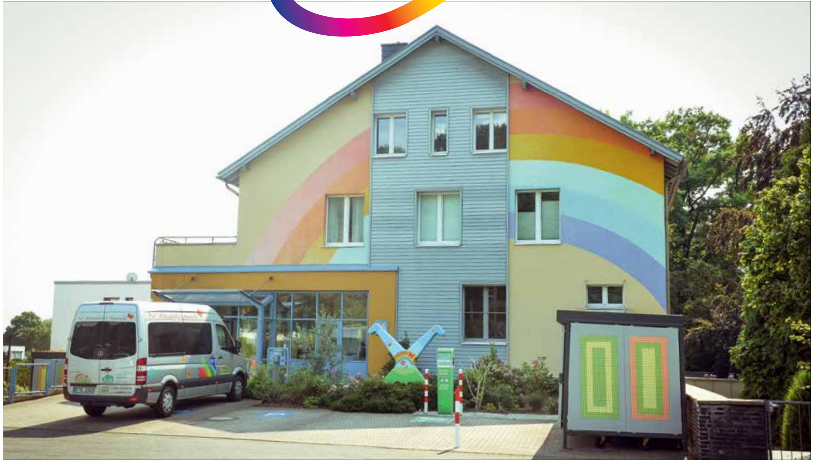
Kinder- und Jugendhospiz Regenbogenland, Torfbruchstraße 25, Düsseldorf

In den letzten 25 Jahren hat sich die Farbigkeit des Regenbogens dank Ihrer Unterstützung stark entwickelt. Deshalb sagen wir an dieser Stelle herzlichen Dank an Sie, unsere Unterstützer, unsere ehrenamtlichen Helferinnen und Helfer und unseren engagierten Mitarbeitenden. 25 Jahre sind kein Grund sich auszuruhen, sondern Ansporn, die vielfältigen Themen und Probleme mit frischer Energie anzugehen.