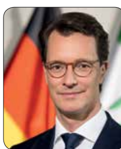
Hendrik Wüst Mdl. Ministerpräsident des Landes Nordrhein-Westfalen

Zu den bewegendsten Momenten des vergangenen Jahres gehörte für mich mein Besuch des Regengebogenlandes. Mitzuerleben, wie liebevoll und einfühlsam sich die hauptamtlichen Mitarbeiter und Ehrenamtlichen dort um schwerstkranke Kinder und Jugendliche kümmern, hat mich tief beeindruckt. Und es hat mich tief bewegt zu sehen, wie stark die Mädchen und Jungen trotz ihres schweren Schicksals sind.